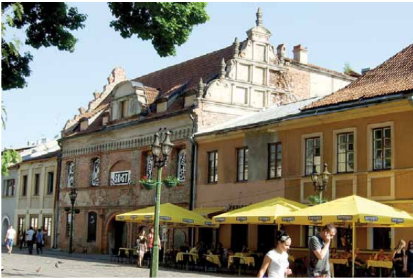
1, 2 pav. Nenaudojami, apleisti namai Kauno Laisvės alėjoje ir Vilniaus gatvėje

Figs. 1, 2. Unexploited derelict houses in Kaunas, Laisves Av. and Vilniaus St.