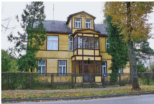
9 pav. Gerai išlikęs medinis namas Panemunėje, Smetonos al. 81