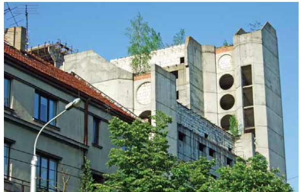
4 pav. Nebaigtas viešbutis Kaune, Kęstučio g. – sovietinių metų utopijos simbolis

Fig. 3. Investors who carry out the conversion of „Tulpe“ building at Laisves Av. „forgot“ to complete the piece above the entry