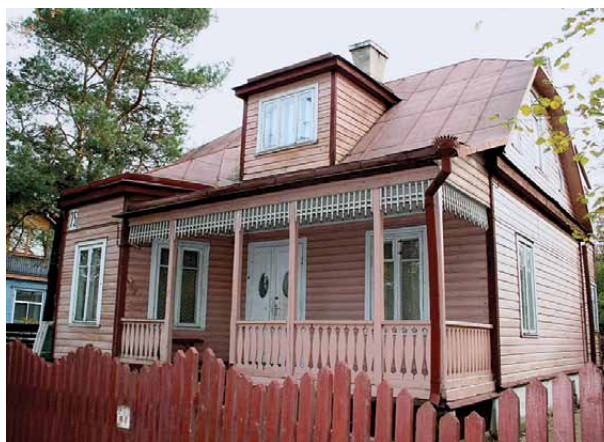
11, 12 pav. Autentiškos architektūros namai Žemuočių g. 2 (įtrauktas į Kultūros vertybių registrą) ir Smetonos al. 75