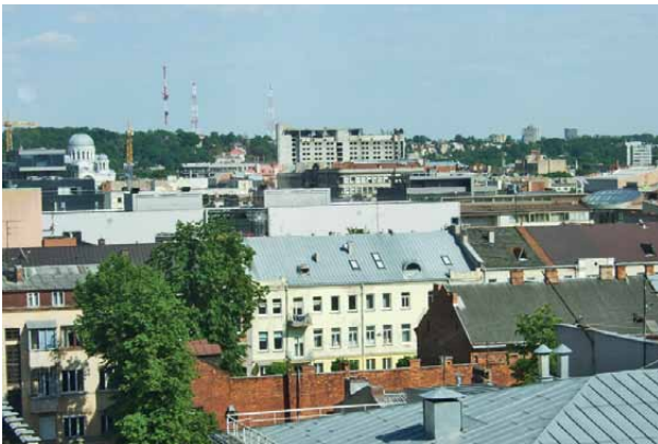
6 pav. Disonuojantys akcentai Kauno Naujamiestio panoramoje

Fig. 5. The famous trade house “Merkurijus” (Kaunas) is demolished, but new building is far from being