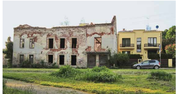
7, 8 pav. Ilgiau nenaudojami namai (Kaunas, Palangos g., Totorių g.) virsta griuvėsiais

Figs. 7, 8. Unexploited houses (Kaunas, Palangos St., Totoriu St.) eventually turn to ruin