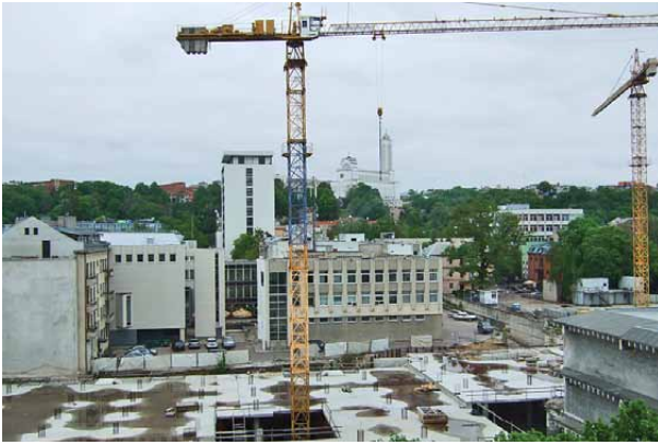
5 pav. Žymusis Kauno „Merkurijus“ nugriautas, tačiau žadėto naujo statinio dar ilgai reikės laukti

Fig. 5. The famous trade house “Merkurijus” (Kaunas) is demolished, but new building is far from being