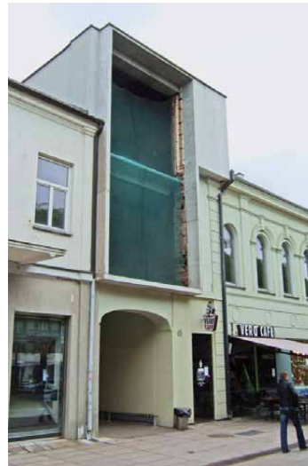
3 pav. Laisvės alėjos „Tulpę“ perstatę investitoriai „pamiršo“ užbaigti antstatą virš įvažos