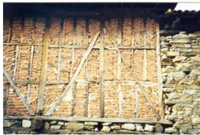
Pastato siena Cumalikizik (Turkija)

Šiandien Europos bendruomenės dėmesį ypač traukia ne išskirtinės vertės medinio paveldo statiniai, kurių išlikimą dalinai garantuoja architektūrinės – meninės vertės unikalumas, o foninio pobūdžio vietinė (liaudiška) vernacular architektūra, atspindinti daugiasluoksnį visuomenės gyvenimo būdą. Miestų ir priemiesčių medinė architektūra – vienas reikšmingiausių ir kartu problematiškiausių šios rūšies paveldo objektų. Keičiantis žmonių gyvenimo būdai ir mąstysenai, ji labai greitai kinta. Miestų ir priemiesčių medinio paveldo išsaugojimo problemos išsivysčiusiose valstybėse iškilo prieš kelias dešimtis metų itin greit plečiantis miestams ir augant gyventojų pragyvenimo lygiui.