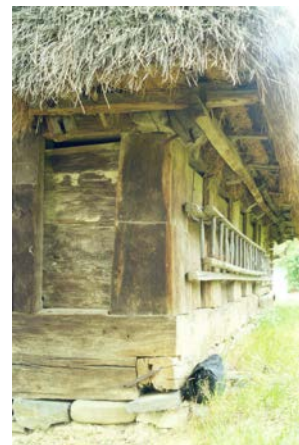
Svirno fragmentas, Maramures (Rumunija)