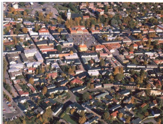
Raumos (Suomija) senamiestis

Medinės architektūros likimas priklauso nuo paminklotvarkos politiką vykdančių organizacijų, kurių požiūris iš dalies atspindi plačiosios visuomenės požiūrį. Bene didžiausias dėmesys medžiui yra skiriamas Skandinavijos šalyse. Suomija, Švedija, Norvegija, Islandija, Danija miestų medinės architektūros apsaugos klausimus kelis dešimtmečius gvildena nuosekliai organizuojamuose kongresuose “Nordisk treuke: sustainable Urban Habitat in Wood”. Per 30 metų, nuo pirmojo projekto – “The nordic wooden towns projects” Norvegijoje gimimo, šalims pavyko pakeisti visuomenės požiūrį į medinę architektūrą, o jos vertę prilyginti mūrinio paveldo vertei. Roros miestelio Norvegijoje (1974 m.), Raumos medinio senamiestio Suomijoje (1991 m.) ir Vysbio miesto medinės dalies Danijoje įtraukimas į Pasaulinio paveldo sąrašą patvirtina gero darbo rezultatus.