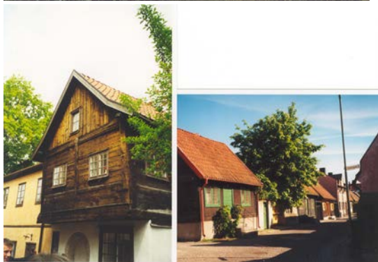
Vysbio ( Švedija) senamiesčio fragmentai

Požiūrį pavyko pakeisti judėjime už medinio paveldo išlikimą suvienijus specialistus, savivaldybes, visuomenines organizacijas, privačius asmenis. Labai didelis vaidmuo teko valstybei, kuri finansiškai rėmė vertybių atkūrimo procesą bei padėjo įdiegti švietimo projektus mokyklose, universitetuose. Dėka viso to medinis paveldas Skandinavijos šalyse šiandien visuomenės suvokiamas kaip dalis savasties, kuria reikia didžiuotis, o miestų ir miestelių vystimosi ir plėtros planuose medinė architektūra vertinama ir saugoma.