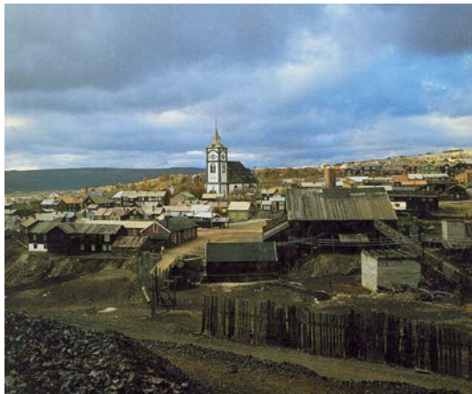
Roros (Norvegija) miestelio vaizdas