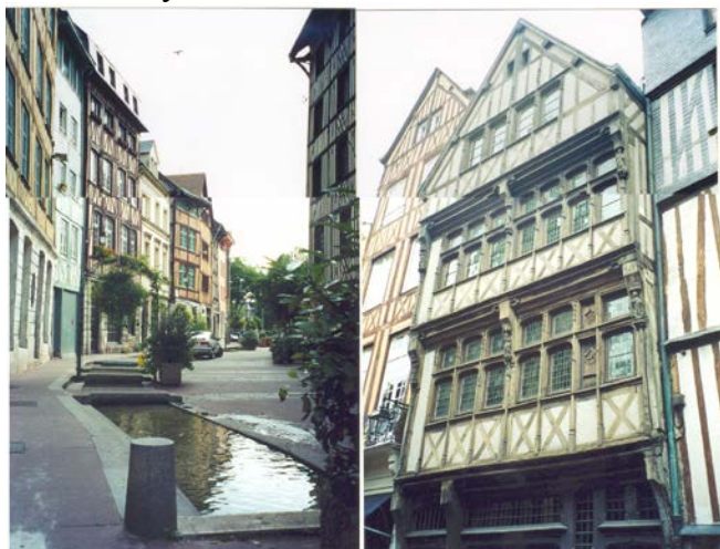
XVI- XVII a. saugomi ir restauruojami fachverkiniai namai Rueno mieste Normandijoje (Prancūzija)

Vakarų Europos šalyse medinis paveldas yra sudedamoji bendro paveldo dalis. Dėl aukšto visuomenės kultūros lygio ir dėl to gana sėkmingai veikiančių apsaugos įstatymų bei programų, kuriuose aktyviai dalyvauja visuomenė ir vietos valdymo įstaigos, medinis paveldas saugomas. Jo išlikimo problemos yra daugiau techninės, nei ideologinės. Vertė suvokiama bendrame kontekste. Pastatų apsaugą finansiškai remia valstybė.