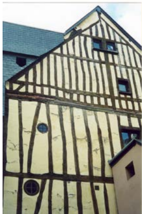
Namo fragmentas Ruenas (Prancūzija)